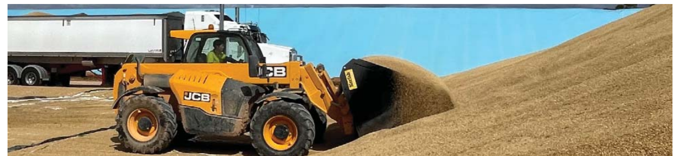
1 Biji-bijian termasuk sereal, biji-bijian kasar, kacang-kacangan, biji minyak nabati, dan produk oilseed crush 2 Laporan Komoditas ABARES

Sehingga kata "kualitas" memiliki interpretasi dan penekanan yang berbeda, tergantung pada posisi Anda dalam rantai pasokan gandum.